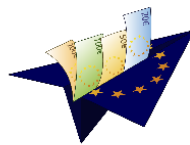
EU-FUNDING-BIDS © EUCONTACT AT HOME IN EUROPE LTD.

INTERNETBASIERTE BERUFS-SPEZIFISCHE FREMDSPRACHEN - KURSE im Rahmen von im Kundenauftrag durch EUCONTACT entwickelten und realisierten MATCHING PROJEKTEN .