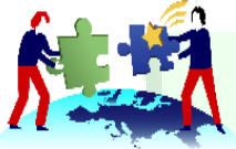
MATCHING STRATEGIES © EUCONTACT AT HOME IN EUROPE LTD.

MATCHING STRATEGIES für eine GRENZÜBERSCHREITENDE BERUFS-SPEZIFISCHE NACHWUCHSGEWINNUNG durch MATCHING PROJEKTE im EU - BINNENMARKT und EFTA RAUM.