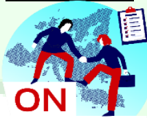
ON BOARDING © EUCONTACT AT HOME IN EUROPE LTD.

Entwicklung und Umsetzung BERUFLICHER MOBILITÄTEN für junge Menschen in der beruflichen Erstausbildung zwischen EU - Ländern im EU - BINNENMARKT .